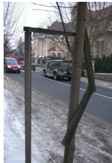
Obrázek 5, 6, 7: Nově vysazené stromy poškozovány vlivem absence následné péče. Leden 2010