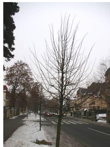
Obrázek 4: Nově vysazené stromy bez výchovného řezu. Ulice Pod Doubravkou. Leden 2010