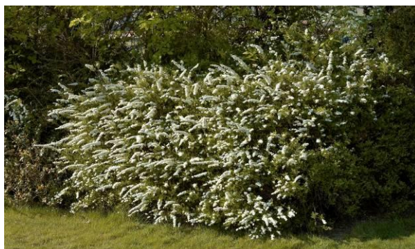
Obrázek 11: Vlevo tavolník v Janáčkových sadech po neodborném řezu, vpravo jeho ideální tvar a efekt. 2009