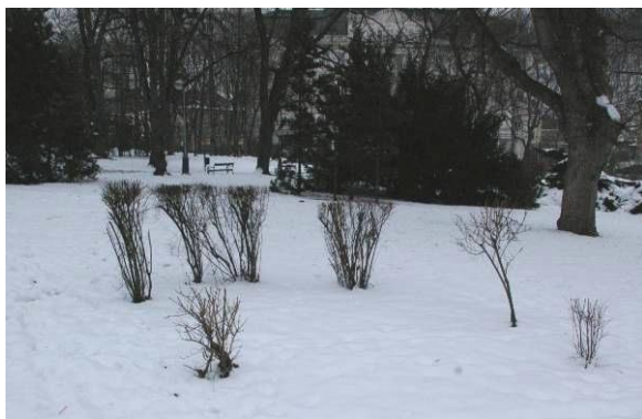
Obrázek 8: Neodborně udržována skupina keřů, lázeňský park. Leden 2010