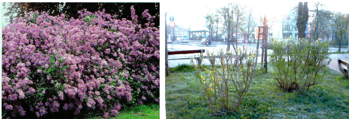
Obrázek 12: Obr. č. 12: Šeřík je krásná solitera, vpravo po nepochopitelném řezu. Sídliště Šanov. Květen 2009