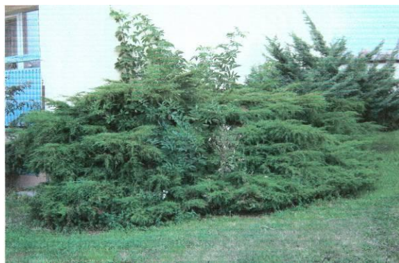
Obrázek 9: Náletové dřeviny ve stávajících keřích nejsou odstraňovány. Nová Ves. Červen 2009