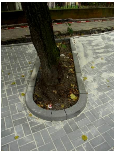
Obrázek 2: Kořenový prostor lip, rekonstrukce Čapkovy ulice. Září 2009