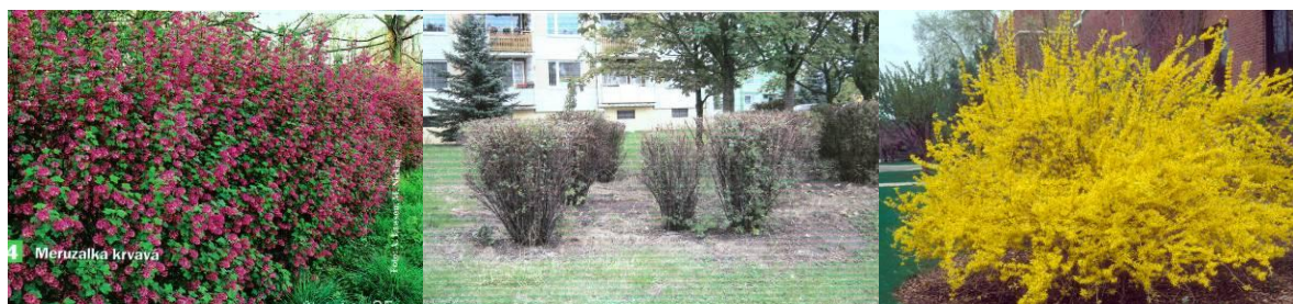
Obrázek 13: Keře dokáží zpříjemnit život na sídlišti, nutné je zajištění odborné péče. Uprostřed stav na Nové Vsi, po stranách jak by měly keře vypadat. Nová Ves. Léto 2009