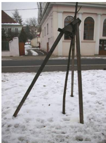
Obrázek 3: Kůly mají zajišťovat stabilitu stromu, příklad ukazuje opak. Šanovský park. Leden 2010