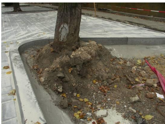
Obrázek 1: Destrukční zásah do kořenového systému lip při rekonstrukci Čapkovy ulice. Zář 2009